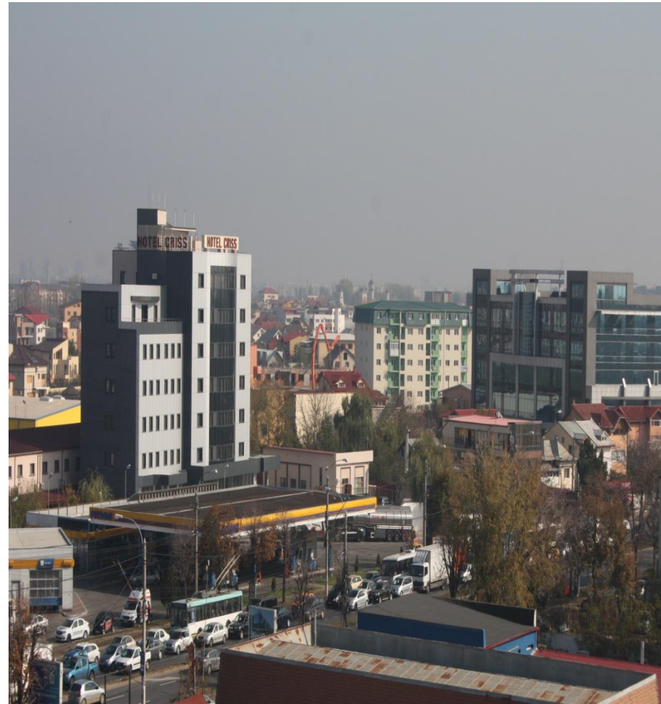
Hotel CRISS - Bucuresti